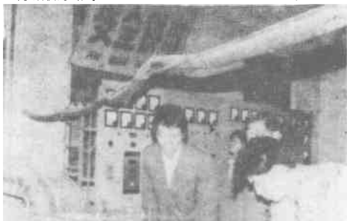
图为职工为用户检修设备。