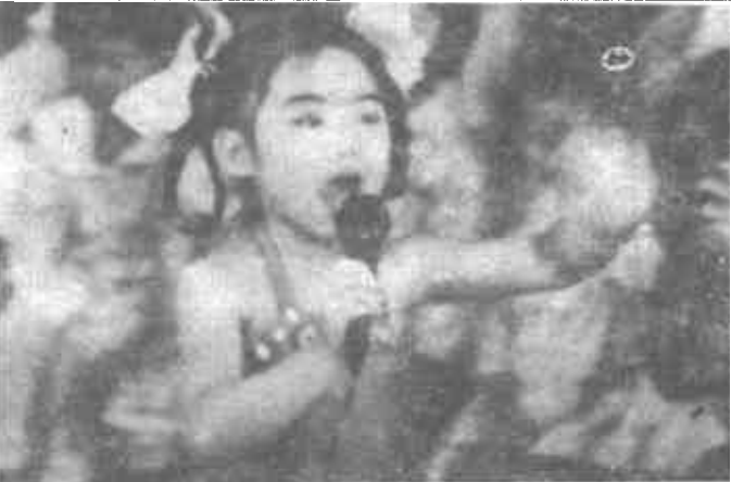
市府二幼在幼教工作中，注意发现和培养幼儿的各种艺术天赋，专门开设了绘画、舞蹈、音乐等科目，收到良好的教育效果。瞧，这位小歌手多潇洒！

为从根本上消除车匪路霸犯罪隐患，力求整治一段搞好一片，侦破一案挖出一串安定一方。各级公安机关坚持“两手抓”、“两手硬”的方针，加大人防并举，标本兼治的力度。派出干警深入到多发案路段沿线调查摸底，并对犯罪分子经常出没，活动频繁的重点区域，部署警力控制阵线，在重点路段和重点区域设立报警点，组织巡警队坚持昼夜巡逻，减少了案件发生，提高了整体预防、发现、查控、打击车匪路霸犯罪分子能力。（王旭东）