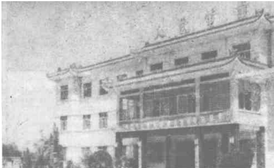
图为大王供电电站一角。